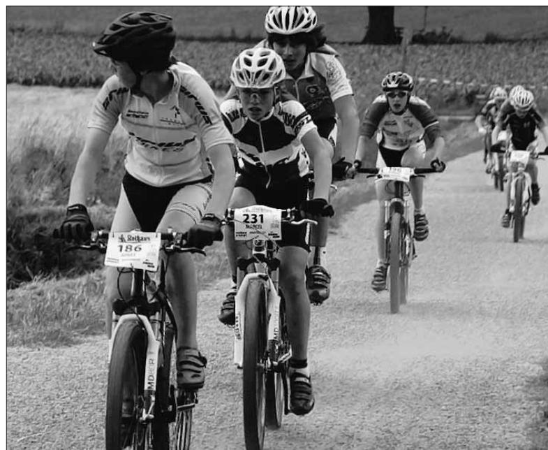
Kampf um jeden Meter Strecke: Die Mountainbiker liefern sich in Kirchzarten im Schwarzwald ein spannendes Rennen.

Die restlichen drei Fahrer aus dem Westallgäu, die die Herausforderung annahmen, starteten allesamt in der Klasse U15 im Rahmen der Schülersichtung des Deutschen Radsportbun-